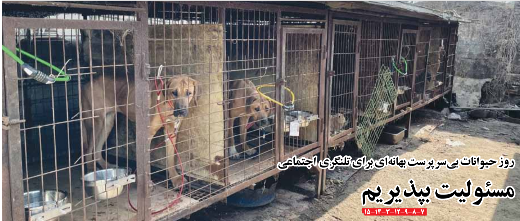
روز حیوانات بی سرپرست بهانه ای برای تلنگری اجتماعی

روند رو به رشد تورم در کشور مشکلات زیادی را در بخش های گوناگون به ویژه بازار مسکن ایجاد کرده و با توجه به هزینه های سنگین این مولفه در سبد خانوار، امید دهک های پایین برای خرید خانه، کم رنگ شده است. در این میان، عزم جدی دولت برای ساخت ۴ میلیون واحد مسکونی، تا کنون نتوانسته گرهی از مشکلات این بازار باز