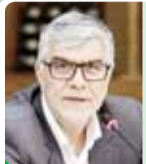
مؤرخ و پژوهشگر دولتی کارشناس بازار مسکن

افزایش شهرنشینی و نیاز به ساخت‌وساز با سرعت بیشتر و کیفیت بالاتر باید ما را به این فکر بیندازد که در ساختمان‌سازی باید به سوی صنعتی‌سازی پیش برویم که یکی از این شاخه‌ها صنعتی شدن در فضاهای معماری است، اما به نظر می‌رسد با حرکت بخش ساخت‌وساز مسکونی به سمت صنعتی‌سازی، معماری سنتی ایرانی به فراموشی سپرده می‌شود.