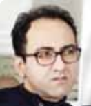
پایک کلانی فعال اقتصادی

کمیت و کیفیت شاخص‌های مثبت موثر بین فعالان تولید و بازار محصولات غیرنفتی در برابر شاخص‌های منفی آن، آن‌قدر ابتدایی، قدیمی، ناچیز و سنتی مدیریت می‌شود که کمابیش می‌توان تمام آنها را نادیده گرفت. از جمله مهم‌ترین این شاخص‌های منفی، نقش پررنگ واسطه‌های دولتی و خصوصی و سنتی بودن روش‌ها و برنامه‌های تجارت و بازرگانی است. در این فرآیند، فعالان اقتصادی از زنجیره تولید تا بازار صادراتی، سنتی و جزیره‌ای عمل کرده و این مهم باعث شده، تاکنون برنامه‌های متعدد دولت‌ها، مشکل سرگردانی تنظیم بازار و موانع توسعه صادرات محصولات غیر نفتی را حل نکنند.